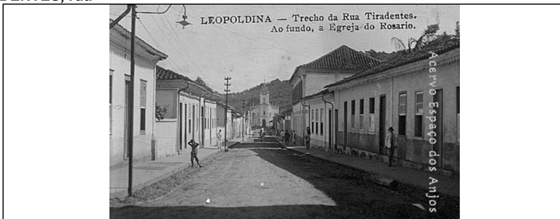
Parte baixa da rua Tiradentes