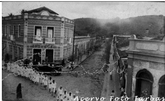
Ao lado, encontro da rua Tiradentes com a rua Cotegipe

(Centro) – Liga a Cotegipe à praça do Rosário. É uma das ruas mais antigas da cidade. Seu primeiro nome foi “Rosário”.